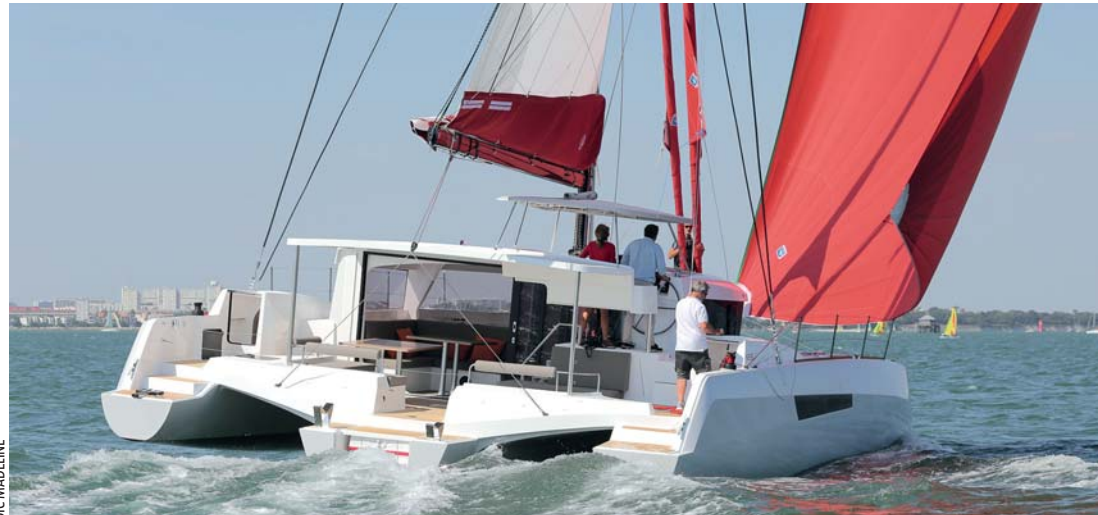
Neel 47. Sur ce modèle, les cabines installées dans les flotteurs ne communiquent pas avec la nacelle. Difficile d'offrir plus d'intimité à bord d'un multicoque.

quatre cabines doubles avec autant de cabinets de toilette et a imposé une continuité entre cockpit et carré, une disposition baptisée «cockloot» qui gomme le passage entre intérieur et extérieur. A bord du 51, la cabine propriétaire est de plain-pied avec le cockpit et le carré se trouve sur tribord. Les autres cabines sont dans les flotteurs et à l'avant de la coque centrale. Le 47 propose des emménagements très différents même si l'on retrouve la cabine proprié-