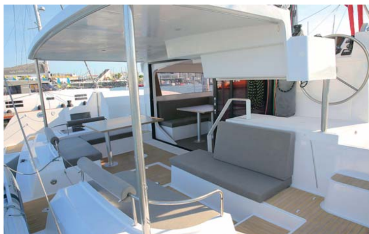
Double cockpit. Sur tribord, un coin salon avec deux banquettes en vis-à-vis, sur bâbord la table de repas, en communication avec le carré.

les voyageurs au long cours. Pour accéder au cabinet de toilette, on descend quelques marches dans la coque centrale. Et l'on dispose alors de trois espaces isolés les uns des autres. Le lavabo au centre commandant l'accès au W.-C. ou à la douche. Cette coque centrale recèle encore une immense soute sous le carré. L'on y stockera tout ce dont a besoin mais aussi le dessalinisateur. Et les invités, et les amis, et les enfants ? Je vous entends d'ici vous alarmer au sujet de ce bateau pour égoïstes. Pas de panique, les flotteurs disposent chacun d'une belle cabine avec un petit lavabo dans l'entrée attenante. Il y a possibilité d'installer des toilettes sous la petite descente. Et en avant de cette pièce humide, la cabine proprement dite, avec de longs hublots de coque pour parer toute claustrophobie. Les couchettes sont belles,