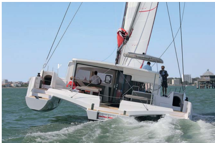
Gîte limitée. En navigation, le Neel 47 se cale sur son flotteur sous le vent. Il ne dépassera pas cet angle de gîte. On voit bien les entrées des cabines latérales.