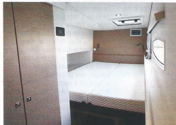
Cabine bâbord. Chacun des flotteurs abrite une grande cabine double et un cabinet de toilette.