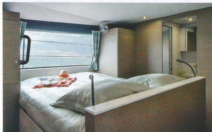
Suite. La cabine propriétaire profite d'une immense baie vitrée, d'un cabinet de toilette privatif et reste de plain-pied avec le carré.