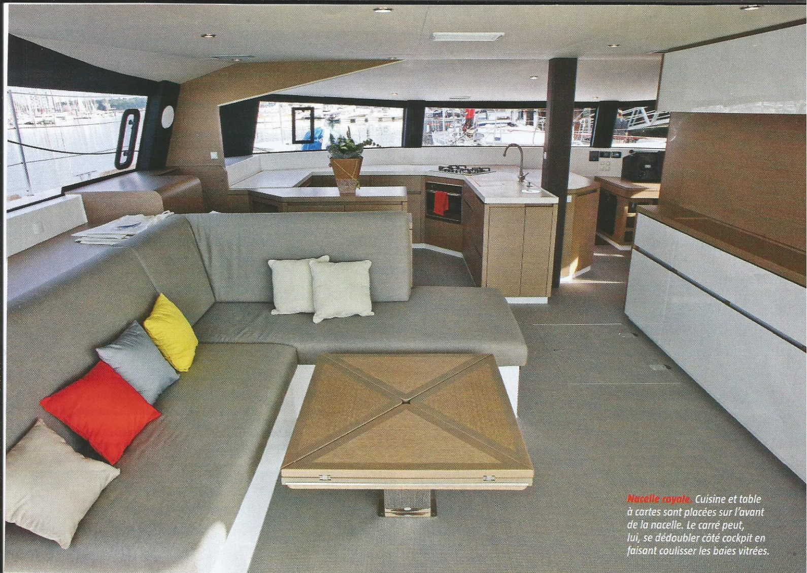
Nacelle royale. Cuisine et table à cartes sont placées sur l'avant de la nacelle. Le carré peut, lui, se dédoubler côté cockpit en faisant coulisser les baies vitrées.

tant de volume dédié aux différents systèmes embarqués, sinon sur des navires à passagers. L'architecture du trimaran, avec la nacelle qui s'étend sur presque toute la largeur, permet vraiment beaucoup d'emménagements. Les mordus de performance peuvent commander un bateau dont les flotteurs ne sont pas aménagés mais il serait déraisonnable de se priver d'aussi belles cabines. Néanmoins, le Neel 51 se présente comme un bateau de grande croisière et chaque propriétaire peut demander à aména-