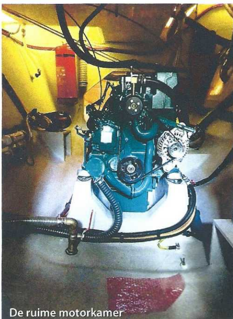
De ruime motorkamer