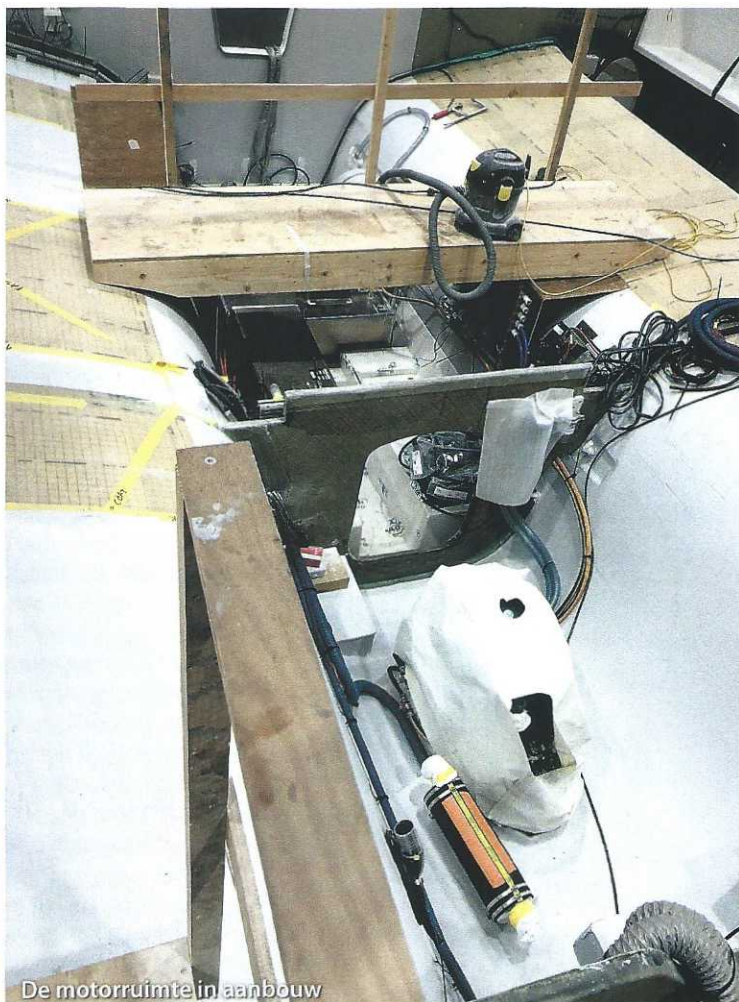
De motorruimte in aanbouw

gewicht van de boot te dragen. Droogvallen is er niet bij en het is zaak dat bij het opbikken dit duidelijk gemaakt wordt aan het jachthavenpersoneel. Dit is zo anders dan ze gewend zijn dus echt opletten.