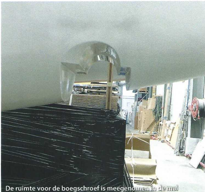
De ruimte voor de boegschroef is meegenomen in de mal