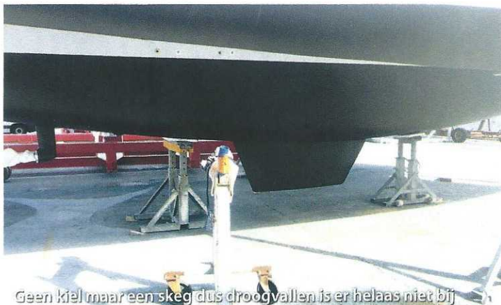
Geen kiel maar een skeg dus droogvallen is er helaas niet bij