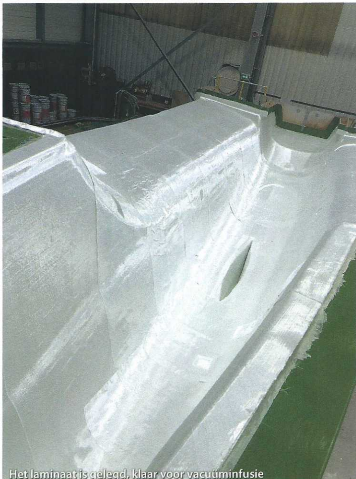
Het laminaat is gelegd, klaar voor vacuüminfusie

wordt waar je als eigenaar/schipper niet veel aan hebt, dus eigenlijk is de Neel-trimaran meer een eigenaarsboot.