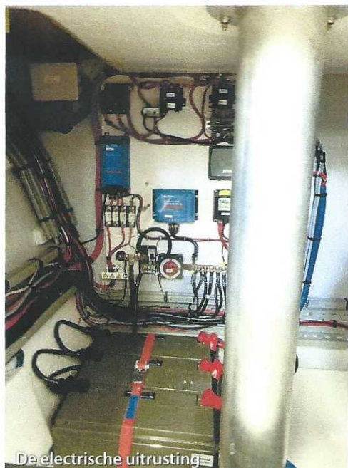
De elektrische uitrusting

ook nog even een draaicirkeldemo, hij wist deze boot met één motor en zonder boegschroef min of meer een pas op de plaats te laten maken à la mijn ex-F-31 met meesturend buitenboordmotortje. Indrukwekkend. Heb je die boegschroef dan nog wel nodig? Ik denk het wel want afspringen zoals je met een enkelromper doet als je aan lagerwal aanlegt, is niet mogelijk, dit door het feit dat een meerromper geen toelopende romp heeft zoals een enkelromper. Een boegschroef is ook heel handig om andere bootjes de stuipen op het lijf te jagen als je in de haven manoeuvreert met je boegschroef roarr. Dubbele functie dus :-)