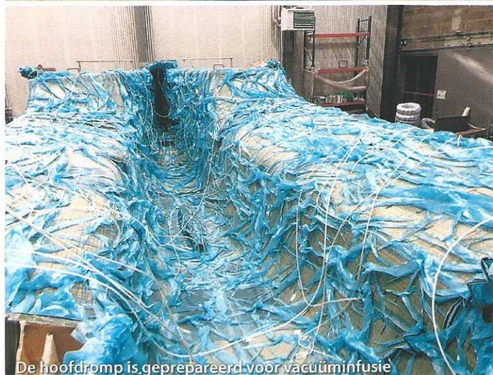
De hoofdromp is geprepareerd voor vacuüminfusie