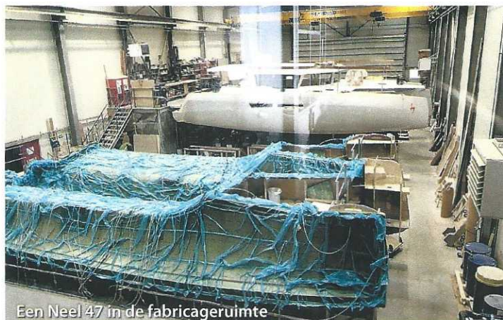
Een Neel 47 in de fabricageruimte